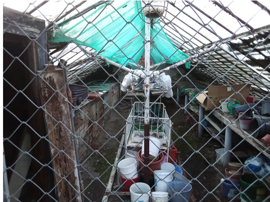
3 - BETONOVÝ BAZÉNEK