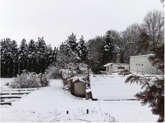
4 - BETONOVÉ ZÁHONY